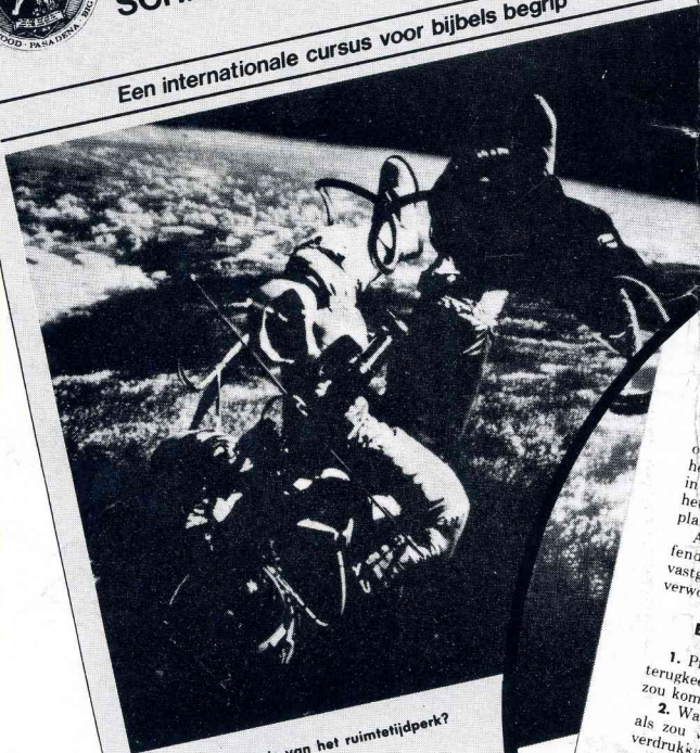
Wat is de betekenis van het ruimtetijdperk?

Een internationale cursus voor bijbels begrip