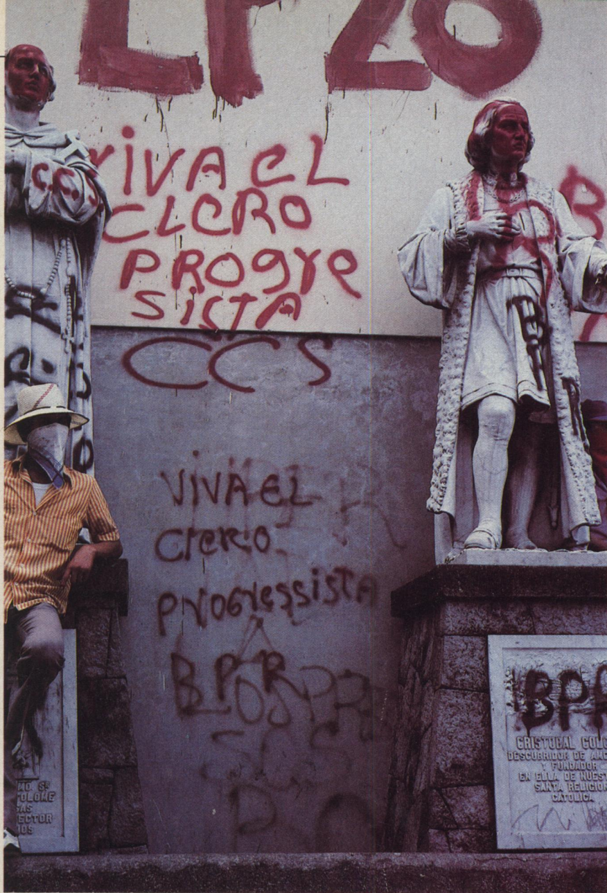
EL SALVADOR — Het standbeeld van Columbus (rechts) beklad door revolutionaire graffiti. De slogan luidt: „Lang leve de progressieve geestelijkheid”. Priesters staan radicale veranderingen voor in delen van Latijns-Amerika.

uit Costa Rica heeft gezet, stond zij wel toe dat het land werd gebruikt als een opstelplaats voor Sandinistische strijdkrachten, terwijl het bovendien als een van hun voornaamste wapenhandelaren optrad.