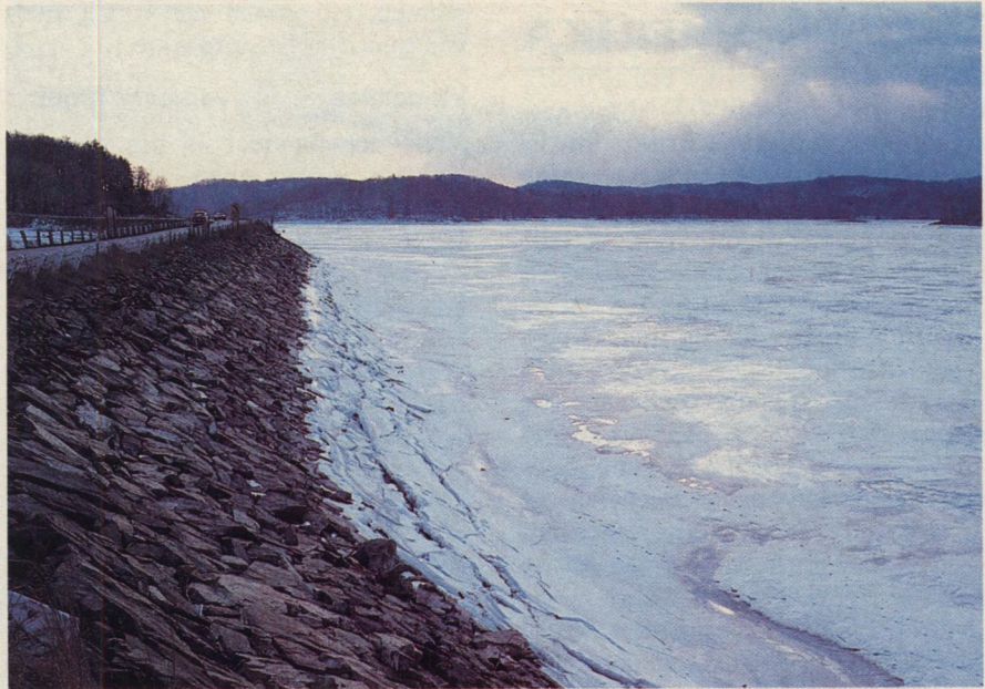
BELANGRIJKE RIVIEREN en reservoirs in het uitgestrekte midden der VS bereikten de laagste waterstand in de geschiedenis. De Mississippi bereikte een peil van 90% onder normaal.

Lees wat God belooft in zijn Woord, de bijbel: „Indien gij dan aandachtig luistert naar de stem van de Here, uw God, en al zijn geboden, die ik u heden opleg, naarstig onderhoudt, dan zal de Here, uw God, u verheffen boven alle volken der aarde. De volgende zegeningen zullen alle over u komen en uw deel worden, indien gij luistert naar de stem van de Here, uw God” (Deut. 28:1-2). Een van die zegeningen, als beloning van gehoorzaamheid is een