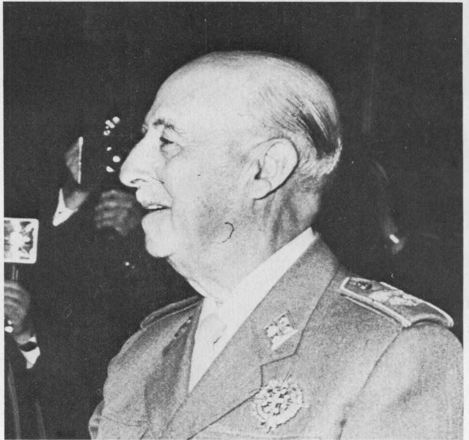
Francisco Franco ... de aanhouder wint ...

Er wonen in Gibraltar — een drukke, bedrijvige vesting der Engelsen — zo'n kleine 19 000 inwoners. Zij zijn uiteraard Engels onderdaan, hoewel door hun aderen het bloed van diverse mediterrane volken stroomt. Het merendeel