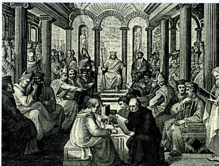
UNSER BILD zeigt, wie es auf dem Konzil zu Nizäa (einberufen von Kaiser Konstantin) zugegangen sein könnte.