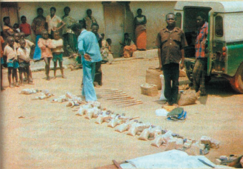
AYUDA PARA LOS PIGMEOS — En estas páginas se aprecian varias escenas de la vida de los pigmeos. Las fotos de arriba muestran bolsas de soya, azadones, machetes y otros elementos que el autor de este artículo (a la izquierda, vestido de camisa roja) ha provisto para la modernización de la agricultura pigmea. En los paquetes de autoayuda, se proveen semillas, jabón y regalitos para los niños.

bilizó. No fue fácil este logro: los pigmeos, por espacio de milenios, habían sido exclusivamente cazadores y recolectores, de modo que han tenido que ir ajustándose muy gradualmente a un estilo de vida completamente diferente, es decir, a una vida más agraria y menos nómada. Una transición abrupta hubiera sido catastrófica: les hubiera llevado de su íntimo, seguro y sereno hogar en el bosque (cada vez más destruido por los madereros, los algodóneros y los cafetaleros) a los abiertos y calcinantes espacios ecuatoriales, situados fuera del bosque. Los pigmeos hubieran sucumbido, víctimas de las enfermedades urbanas (disentería, tuberculosis, frambesía, etc.), de insolaciones y de postración producida por el calor. Pero, lo que es peor aún, su identidad cultural, sus valores morales, su dignidad natural, su espontánea sabiduría y su sorprendente unidad familiar (virtudes tan